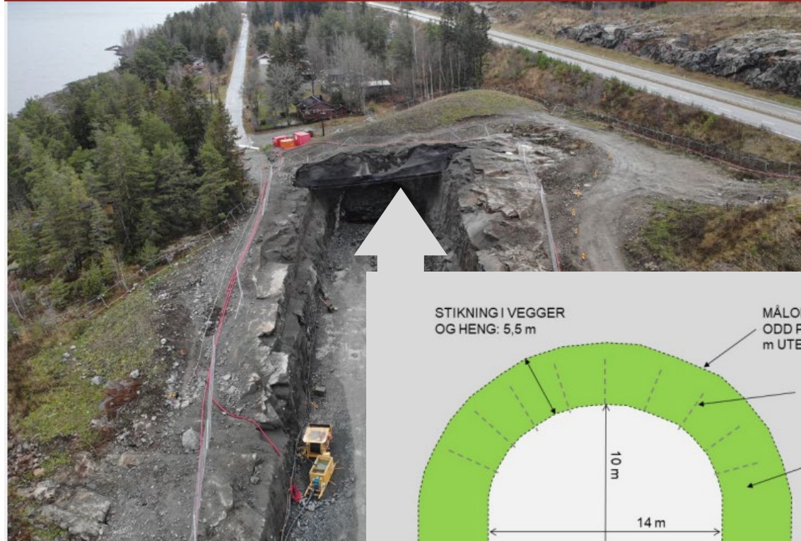
I GANG. I høst startet Veidekke drivingen av den 3,1 km lange tunnelen etter planen er i gang for fullt i desember.