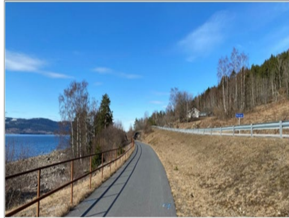
Fv. 1591 Morskogen, Eidsvoll.