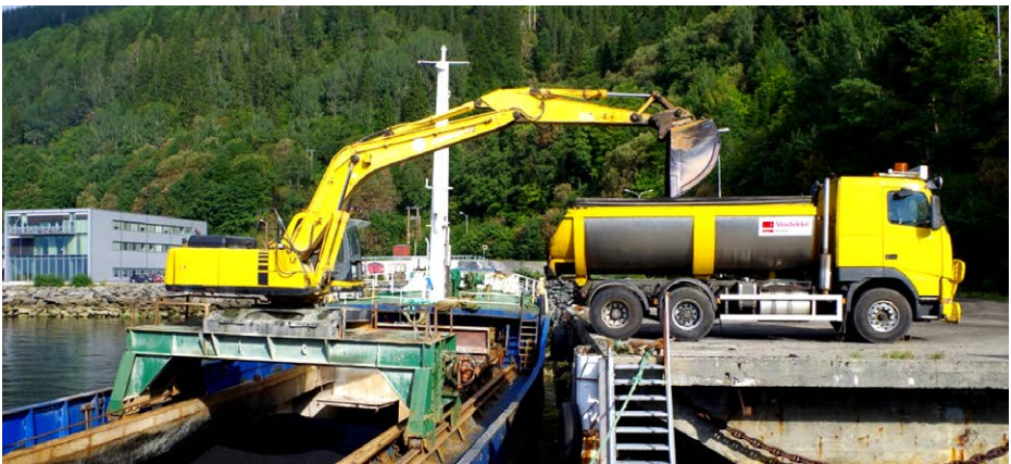
Figur 7: Bilen skal stå vinkelrett på båtsiden ved lossing.

Last aldri bare asfalt fra kantene, som har lavere temperatur, på samme bil. Klumper med kald asfalt og oppsamling av rester i lasterommet skal ikke legges ut, men returneres til asfaltfabrikken.