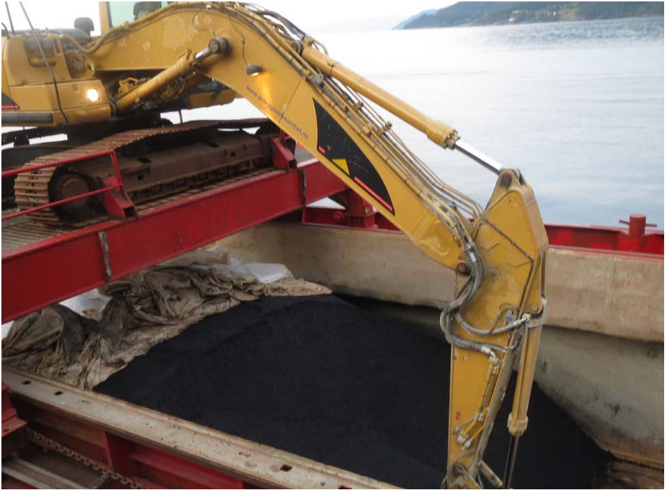
Figur 4: Avdekk lasten gradvis for å unngå varmetap.

Ved lossing av båt må lasten avdekkes trinnvis. Ved stopp i lossingen må lasten dekkes til.