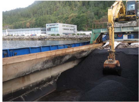
Figur 6: Kald masse som er samlet fra bunn og kanter må ikke lastes på bil.